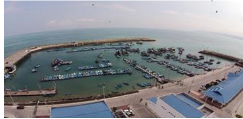
Ilustración 4 Puerto Pesquero Artesanal Jaramijó

Elaborado por: Dirección de Administración de Bienes Permanentes