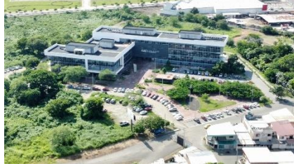
Ilustración 2 Centro de Atención Ciudadana de Portoviejo

Elaborado por: Dirección de Administración de Bienes Permanentes