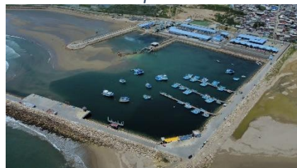
Ilustración 5 Puerto Pesquero Artesanal San Mateo

Elaborado por: Dirección de Administración de Bienes Permanentes