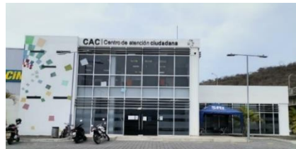
Ilustración 1 Centro de Atención Ciudadana de Bahía de Caráquez

Elaborado por: Dirección de Administración de Bienes Permanentes