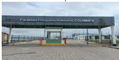
Ilustración 3 Facilidad Pesquera Artesanal Cojimíes

Elaborado por: Dirección de Administración de Bienes Permanentes Fuente: Dirección Zonal 4